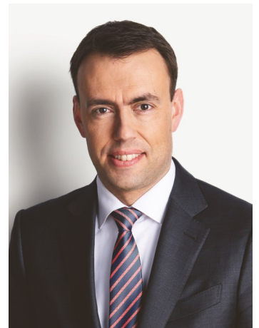
Nils Schmid, SPD-Bundestagsabgeordneter im Wahlkreis Nürtingen

Angesichts aufgeregter Debatten hierzulande um Tankrabatte und Ähnliches, möchte ich an ein Zitat erinnern: „Der Frieden ist nicht alles, aber alles ist ohne den Frieden unserer Exportwirtschaft nichts“. Dieser Satz ist seit nunmehr 30 Jahren Leitgedanke des Willy Brandt-Zentrums Jerusalem. Wie wahr.